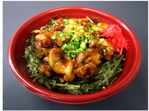
やきとり丼 740 円