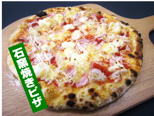
ハムぽてと (トマト味) 800 円