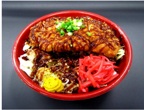
三元豚ソースカツ丼 820 円