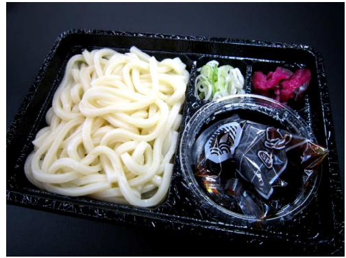
ざるうどん／そば 450 円