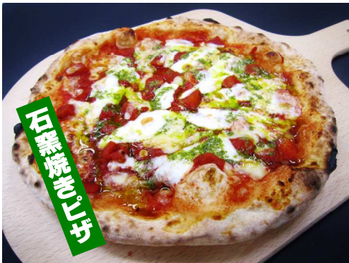
マルゲリータ 750 円