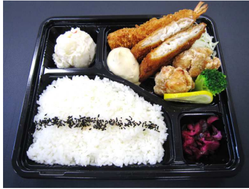
ミックスフライ弁当 840 円