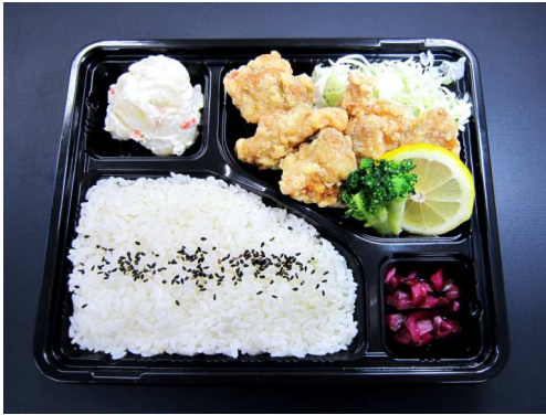
鶏の唐揚げ弁当 790 円