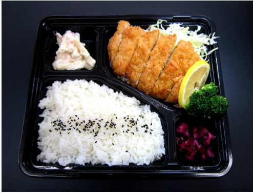
三元豚ロースカツ弁当 880 円