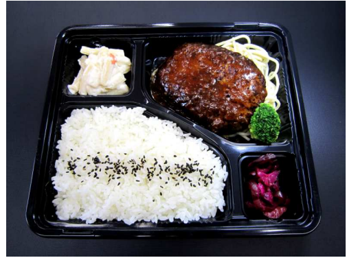
和風ハンバーグ弁当 820 円