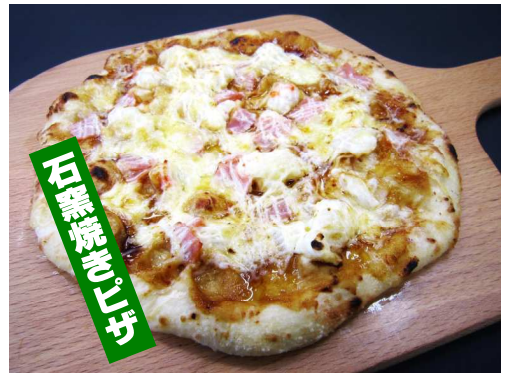
ハムぽてと (てりやき味) 800 円